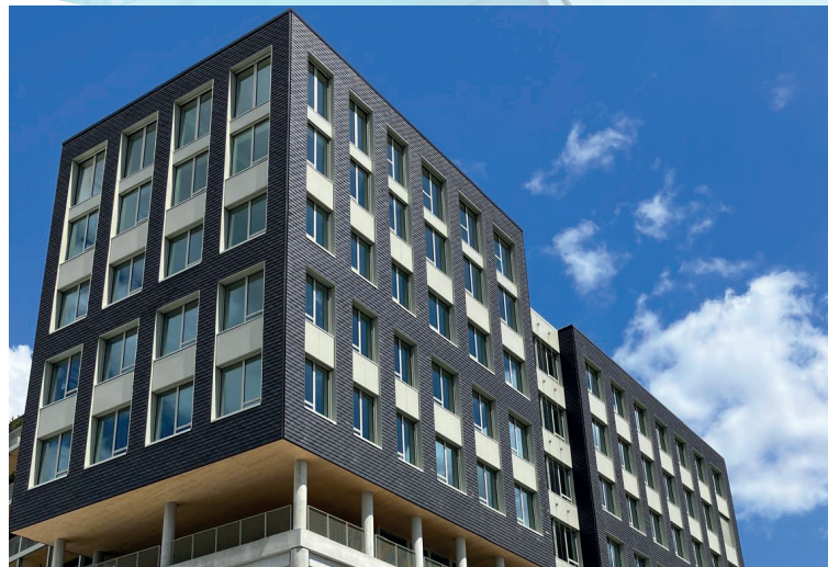
Nantes - Le Carrousel

Fort de ces fondamentaux, le montant du nouvel acompte versé en juillet 2025 s'élève à 11,88 € par part détenue sur l'ensemble du 2 ème trimestre 2025, soit un taux annualisé pour ce trimestre et pour l'ensemble de l'année de 5,25 %. L'assemblée générale mixte de votre SCPI Atlantique Mur Régions s'est également tenue le 10 juin dernier et toutes les résolutions ont été adoptées à la majorité. Toute la société de gestion vous remercie pour votre confiance et votre présence pour ce moment fort d'échange et de partage des informations clés sur votre patrimoine !