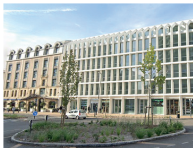
Bordeaux – Infina

L'immeuble INFINA a été acquis en VEFA par la SCPI AMR au 1 er trimestre 2021 auprès du promoteur immobilier ID&AL Groupe moyennant un prix d'environ 17 500 000 € HT. Cet ensemble mixte bureaux et commerces en rez-de-chaussée a été livré le 31 mai 2023 et est loué à trois utilisateurs de premier plan.